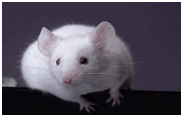
Obr. 1. Obrázek bílé myšky